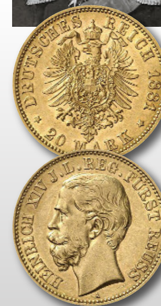
Die Kaiserreich-Münzprägung von Reuß j. L. begann erst 1881 mit 20 Mark Gold.