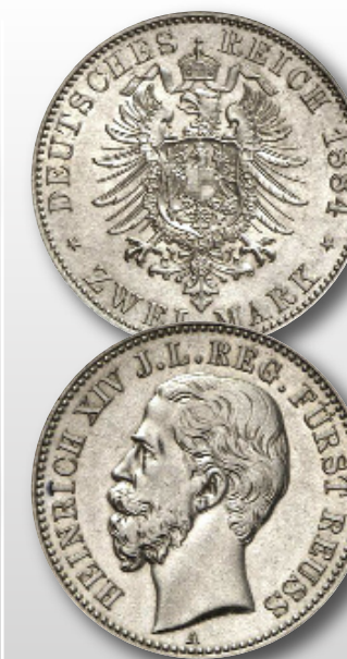
Erste und letzte Silbermünze Heinrichs XIV. von Reuß j. L.: 2 Mark Silber von 1884.