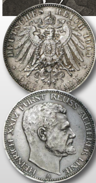
Unter Heinrich XXIV. von Reuß j. L. erschien 1909 nur eine 3-Mark-Silbermünze.