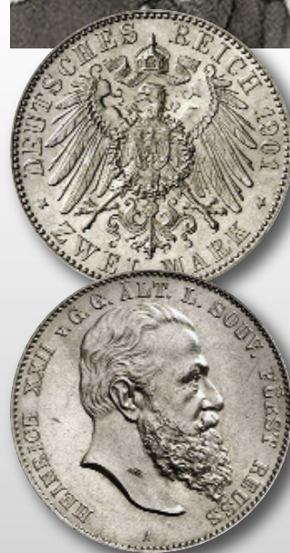
Die letzte Münze des Fürsten Heinrich XXII. von Reuß ä. L.: 2 Mark in Silber von 1901.