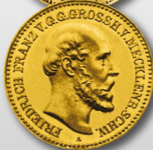
Start mit 10 Mark Gold 1872 von Friedrich Franz II. – noch abgekürzter Nennwert „M.“