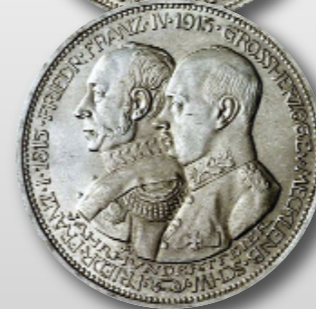
Die letzten Münzausgaben von Mecklenburg-Schwerin zur 100-Jahr-Feier 1915.

In unserer nächsten Ausgabe lesen Sie: Die Kaiserreich-Münzen des Großherzogtums Mecklenburg-Strelitz