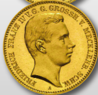
Erste Mark-Goldmünzen von Friedrich Franz IV. zu seiner Volljährigkeit 1901.