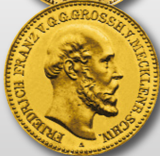
Start mit 10 Mark Gold 1872 von Friedrich Franz II. – noch abgekürzter Nennwert „M.“