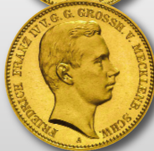
Erste Mark-Goldmünzen von Friedrich Franz IV. zu seiner Volljährigkeit 1901.