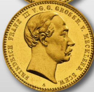
Die einzige Münzausgabe von Friedrich Franz III. war das 10-Mark-Goldstück 1890.