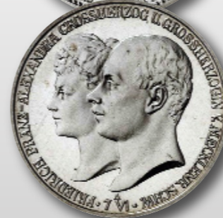
Mark-Gedenkmünzen-Pionier von Friedrich Franz IV. zu seiner Vermählung 1904.