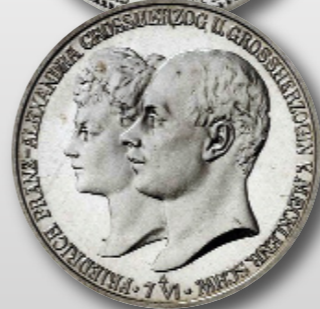
Mark-Gedenkmünzen-Pionier von Friedrich Franz IV. zu seiner Vermählung 1904.