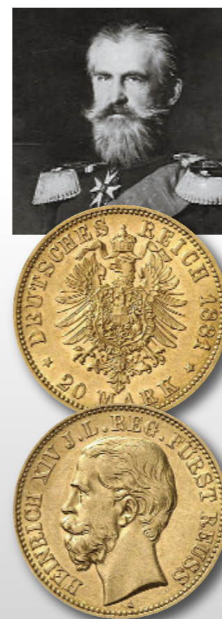
Die Kaiserreich-Münzprägung von Reuß j. L. begann erst 1881 mit 20 Mark Gold.