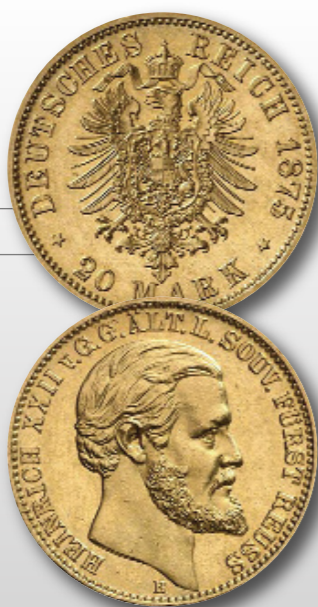
Mit 20 Mark in Gold startete 1875 die Kaiserreich-Münzprägung von Reuß ä. L.

In unserem nächsten Heft lesen Sie: Die Kaiserreich-Münzen des Königreichs Sachsen