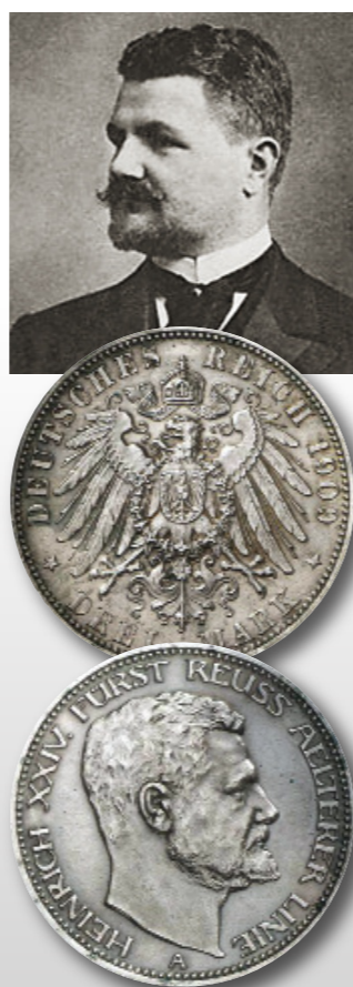
Unter Heinrich XXIV. von Reuß j. L. erschien 1909 nur eine 3-Mark-Silbermünze.