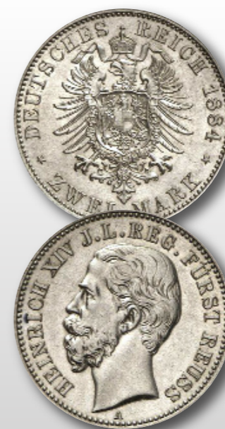
Erste und letzte Silbermünze Heinrichs XIV. von Reuß j. L.: 2 Mark Silber von 1884.