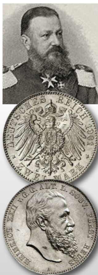
Die letzte Münze des Fürsten Heinrich XXII. von Reuß ä. L.: 2 Mark in Silber von 1901.